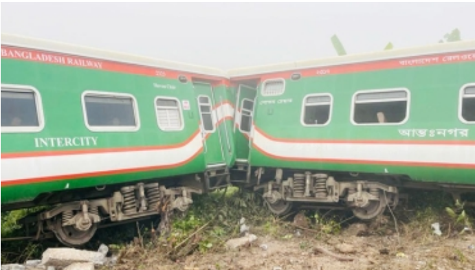
গাজীপুরে ৫ বগি লাইনচ্যুত, ট্রেন চলাচল বন্ধ