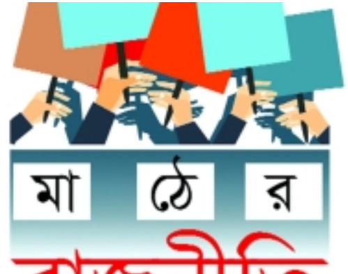
অনেক হিসাব-নিকাশ থাকলেও নৌকার প্রার্থীরা নির্ভর