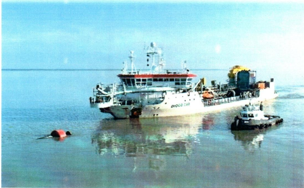
THSD Diogo Cao

স্বাক্ষরিত ৯.০৪.২০২৪ সৌদি আরব মুদ্রা পরিদপ্তর (সি.সি.) পায়রা, বঙ্গবন্ধু সড়ক