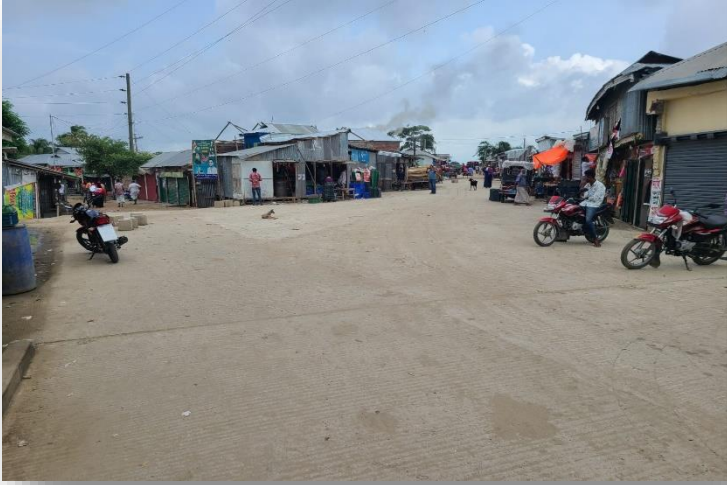
বানাতি বাজার রাস্তা